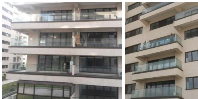
Innflytting i prosjektet My Dream